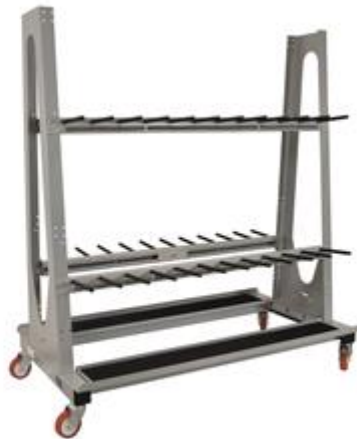
CARR 230-120/22 Q