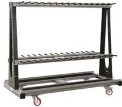
CARR 230-100/30 Q